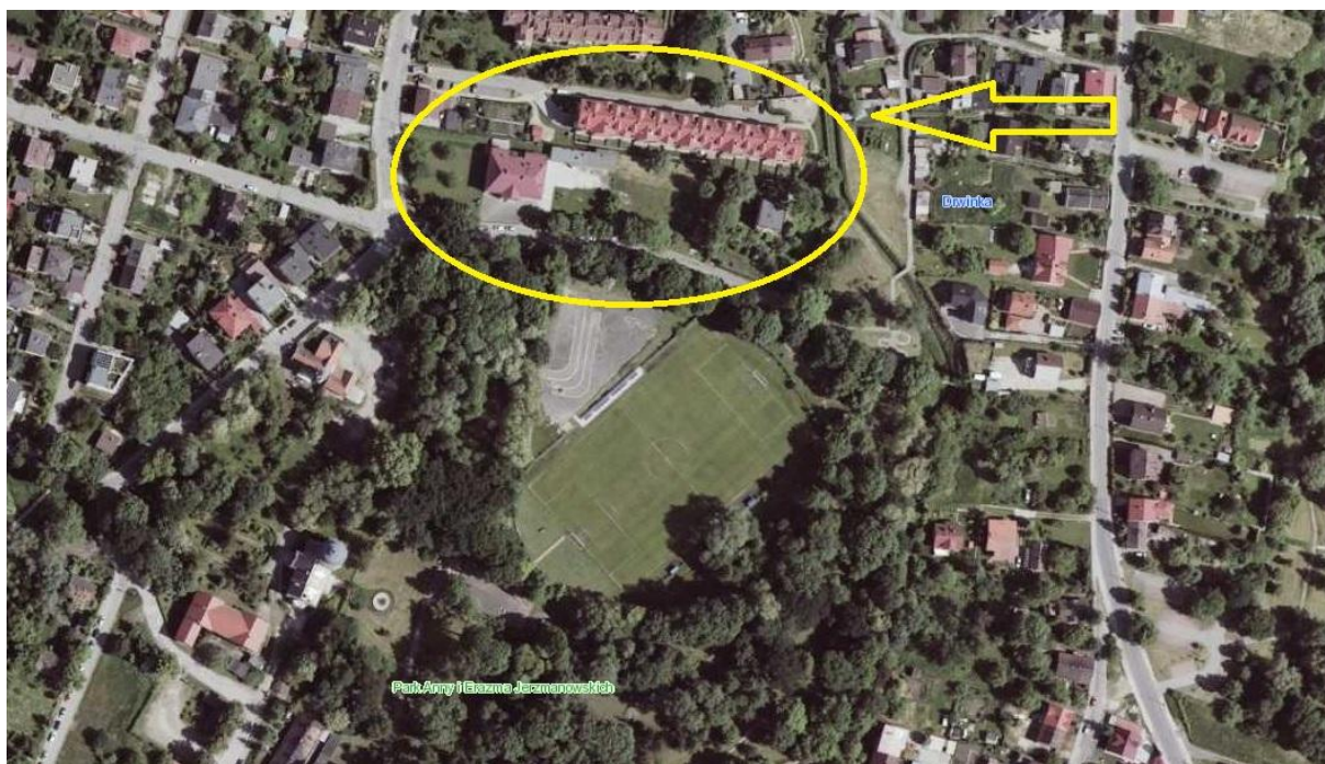
Ryc.1. Lokalizacja terenu opracowania

Teren opracowania należy do MDK i znajduje się w południowo wschodniej części miasta Kraków. Teren o powierzchni ok. 0,50ha, zlokalizowany jest w obrębie ulicy Na Wrzosach.