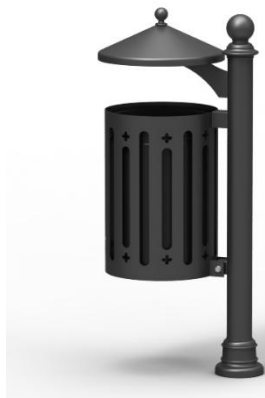
Stylizacja kosza na śmieci

- kosze na śmieci z daszkiem na słupku wykonane ze stali i żeliwa lakierowanego. Wewnątrz korpusu pojemnik z popielniczką. Kolor ciemnozielony RAL 6009. Montaż przez zabetonowanie kotew (przedłużenie nóżki)