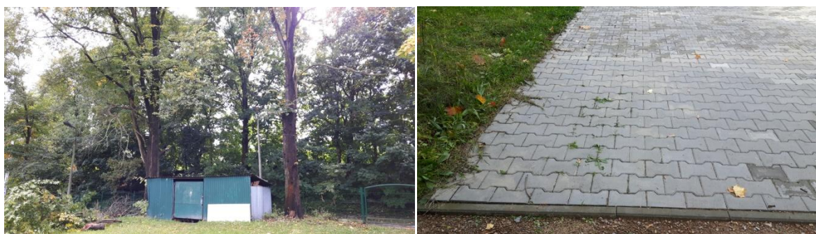
Wyposażenie na terenie opracowania

Dodatkowe wyposażenie stanowią glazy narzutowe (4szt.) umiejscowione naprzeciw Izby Historii oraz wygrodenie w postaci połówek opon samochodowych posadowionych w gruncie na sztorc. Bezpośrednio przy budynku MDK znajdują się dwie ławki drewniane z oparciami na nogach żeliwnych malowanych na kolor ciemnozielony oraz jedna ławka drewniana bez oparcia, siedzisko w kolorze naturalnego drewna. Przy placu przed budynkiem MDK znajduje się ława drewniana na nogach z bali w kolorze naturalnego drewna.