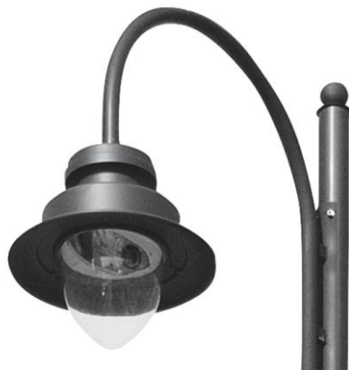
Stylizacja oprawy oświetleniowej

Projektowane oprawy montowane na słupach wys. 4m. Oprawa oświetlenia bezpośredniego, wykonana z aluminium i poliwęglanu. Wersja latarni z diodami LED w połączeniu z okrągłym, zbieżnym słupem ze stali. Słup i elementy oprawy oświetleniowej w kolorze ciemnozielonym RAL 6009. Łączna wysokość latarni z wysięgnikiem 5,43 m. Fundamentowanie zgodnie z zaleceniami producenta.