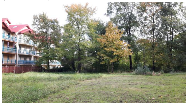
Istniejące trawnik na terenie opracowania

W ramach przeprowadzonej inwentaryzacji opisano 60 gatunków drzew. Drzewa ogólnie są w dobrym stanie fitosanitarnym z wyłączeniem młodych nasadzeń samosiewów.