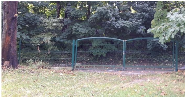
Stylistyka ogrodzenia wzdłuż wschodniej granicy opracowania odpowiadająca istniejącemu ogrodzeniu od str. ul. Na Wrzosach.

Istniejące ogrodzenie od strony południowej (wzdłuż ul. Na Wrzosach) oraz od strony północnej przewiduje się do adaptacji. Projektuje się nowe ogrodzenie wzdłuż wschodniej granicy opracowania – dostosowane formą i kolorystyką do ogrodzenia od str. ul. Na Wrzosach. Ogrodzenie: panel ogrodzeniowy o kształcie półokrągłym wygiętym do góry z prętów zgrzewanych punktowo ze słupkami, malowane proszkowo na kolor ciemnozielony, na niskiej podmurówce betonowej. Długość ok. 40mb.